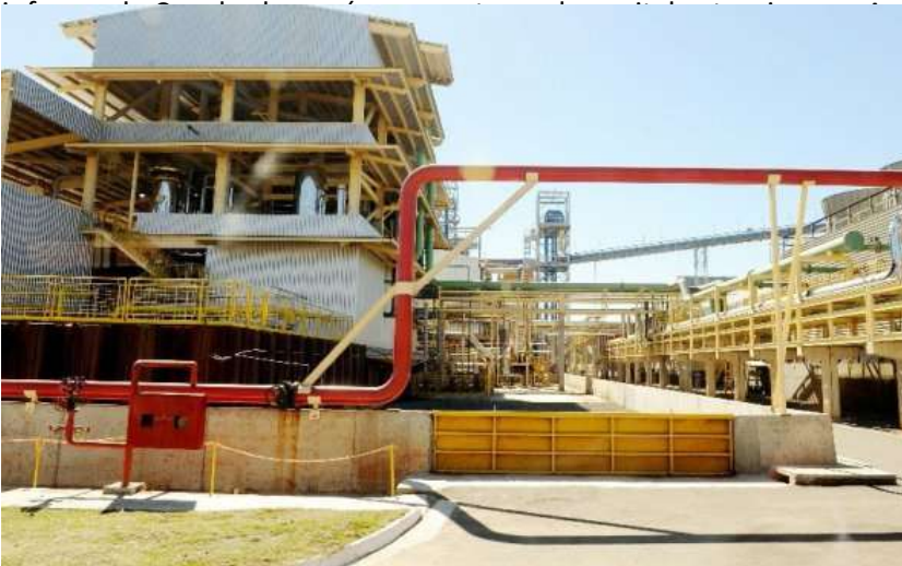
La IED registró un crecimiento del 27% en 2012, según Cepal.

Inversión extranjera, con suba de 27% en 2012 -- La captación de inversión extranjera directa por parte de Paraguay creció un 27%, llegando a US$ 273 millones, según un estudio de la Cepal para América Latina y el Caribe.