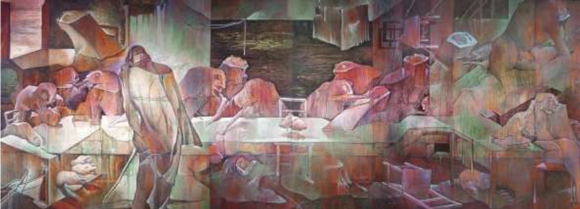
“La próxima cena”, una de sus xilopinturas más representativas, expuesta en el Museo del Barro, donde anoche se velaban sus restos.

El Paraguay pierde a uno de sus mejores hombres -- Ayer a la tarde se apagó la vida de Carlos Santiago Colombino Laílla (Concepción 1937). Su carrera como arquitecto, artista plástico, escritor, promotor cultural y funcionario público tuvo muchas luces y sombras. Paraguay pierde uno de sus mejores hombres, un creador como pocos. Sus restos son velados en la sala que lleva su nombre en el Centro de Artes Visuales.